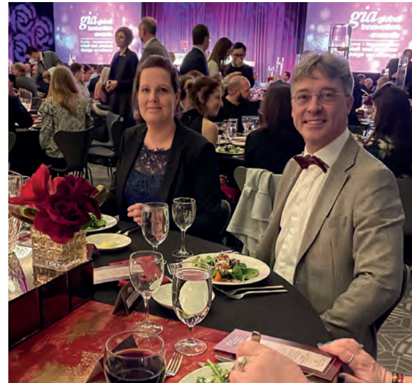
Aan het gia-diner